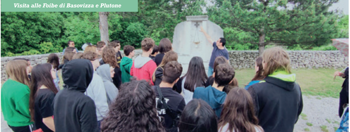
Visita alle Foibe di Basovizza e Plutone