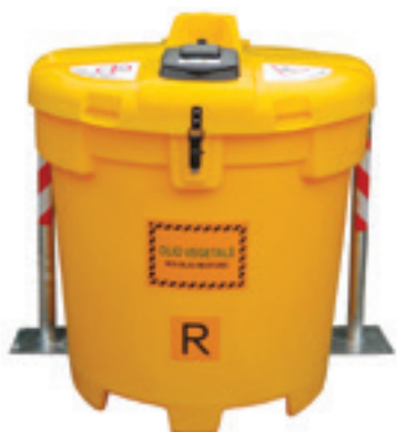
Esempio di cisterna per olio alimentare

OBIETTIVO: AGEVOLARE IL CONFERIMENTO E AUMENTARE LA PERCENTUALE DI RACCOLTA DIFFERENZIATA