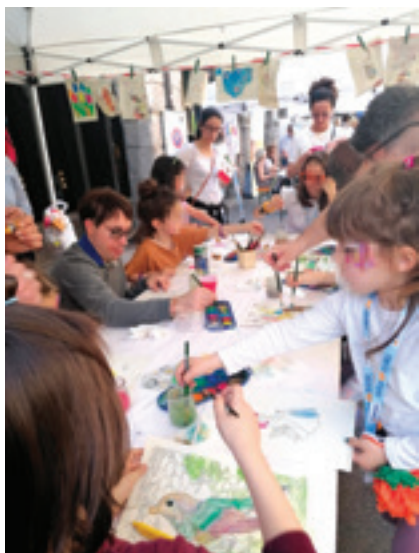
La Città dei Ragazzi

42 associazioni partecipanti, 52 stand di giochi ed attività ludico ricreative, 1427 iscritti.