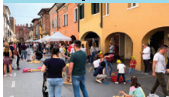
La Città dei Ragazzi

nuare a donare tempo ed energie alla nostra Comunità, diffondendo quella forma di cittadinanza attiva e quella Cultura del Volontariato e dell'inclusione che tanto ci appartengono.