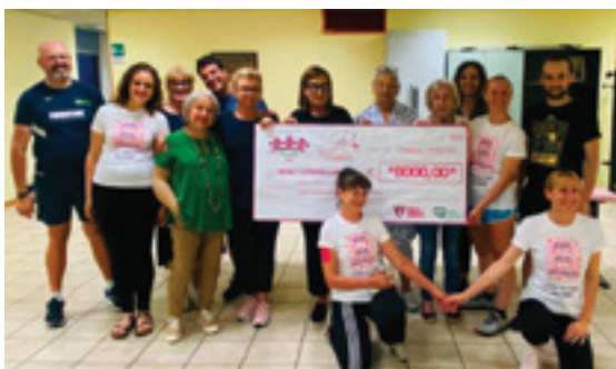
La consegna dell'assegno alle associazioni

nifestazione che è stato devoluto alle associazioni Insieme per mano ODV e Altre Parole