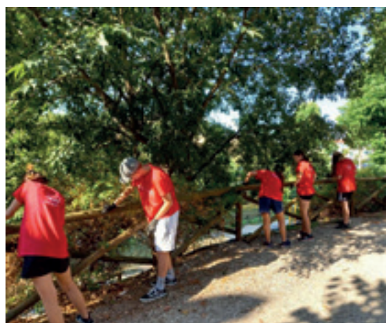
Alcuni ragazzi della scorsa edizione del progetto

Un ringraziamento a tutti i partecipanti: è sempre bello vedere