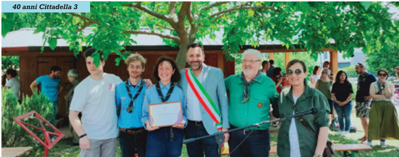
40 anni Cittadella 3

festeggiato i suoi primi 40 anni. Un ringraziamento per tutta l'attività svolta, contribuendo alla crescita e formazione dei nostri ragazzi.