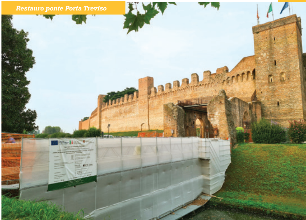
Restauro ponte Porta Treviso

Un ulteriore intervento è stato realizzato anche sul ponte di Porta Bassano con la manutenzione degli attraversamenti pedonali e della pavimentazione in porfido per un investimento di € 62.500,00 grazie ad un contributo del Ministero dell'Interno.