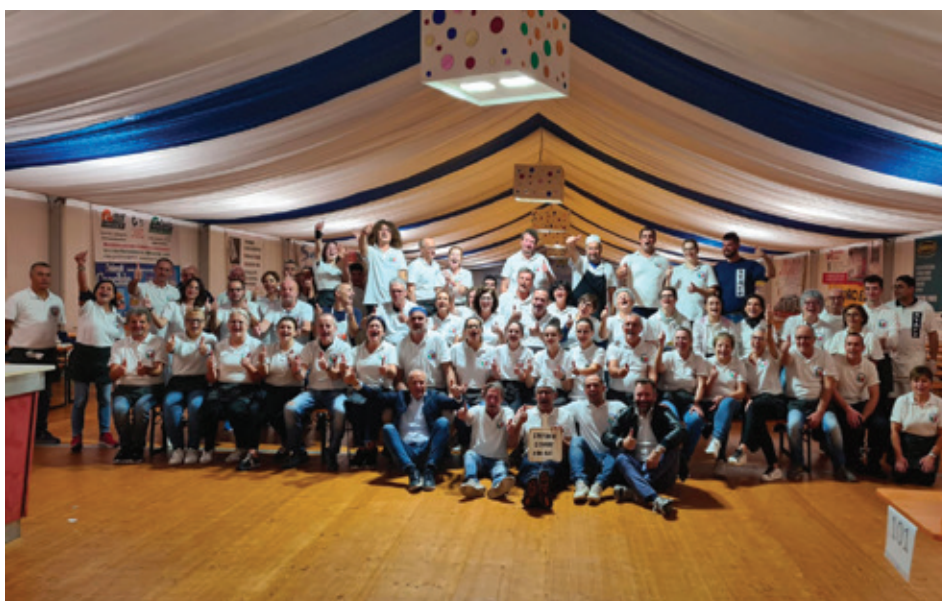
Associazione Volontari Ca'Onorai

I sapori della tradizione veneta portati in tavola grazie all'Associazione Volontari Ca'Onorai.