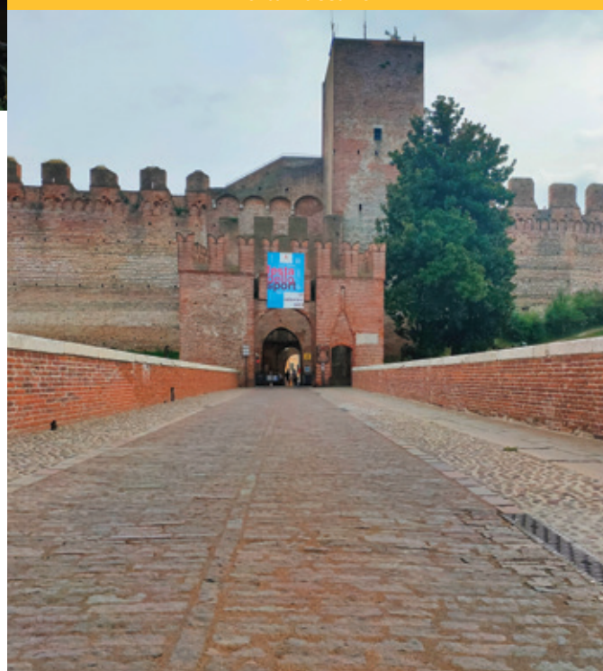
Manutenzione della pavimentazione del ponte di Porta Bassano

REALIZZA LA TUA PERSONALE IDEA DI ABITARE